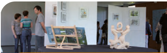
Les premières œuvres ont été dévoilées au public durant les mois de juillet et d'août.